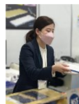
先輩からのメッセージ