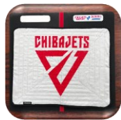
スポーツ用品 (剣道・バスケなど)