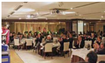
パフォーマーが来て盛り上がっています

仕事とは本来とても楽しいことです。 楽しんで仕事をしてくれる方を求めています。 従業員互助会主催のパーティーを年2回開催し、 工場間・部門間の意思疎通がしやすくなる様に心がけています。